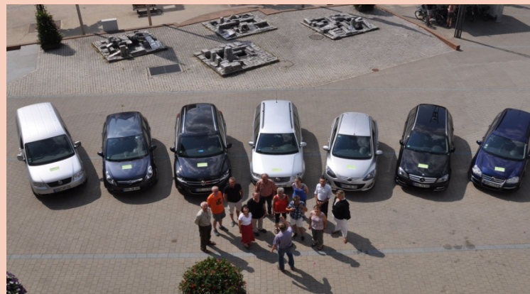
Mitfahrzentrale Heidenheim

Das Landratsamt Alb-Donau-Kreis befindet sich in der Nähe des Ulmer Hauptbahnhofs und ist daher gut mit dem öffentlichen Nah- und Fernverkehr zu erreichen. Vom Bahnhof aus benutzen Sie den Fußgängersteg über die Gleise nach Westen (Schillerstraße) und gehen am Ende des Stegs nach links die Schillerstraße hinunter.